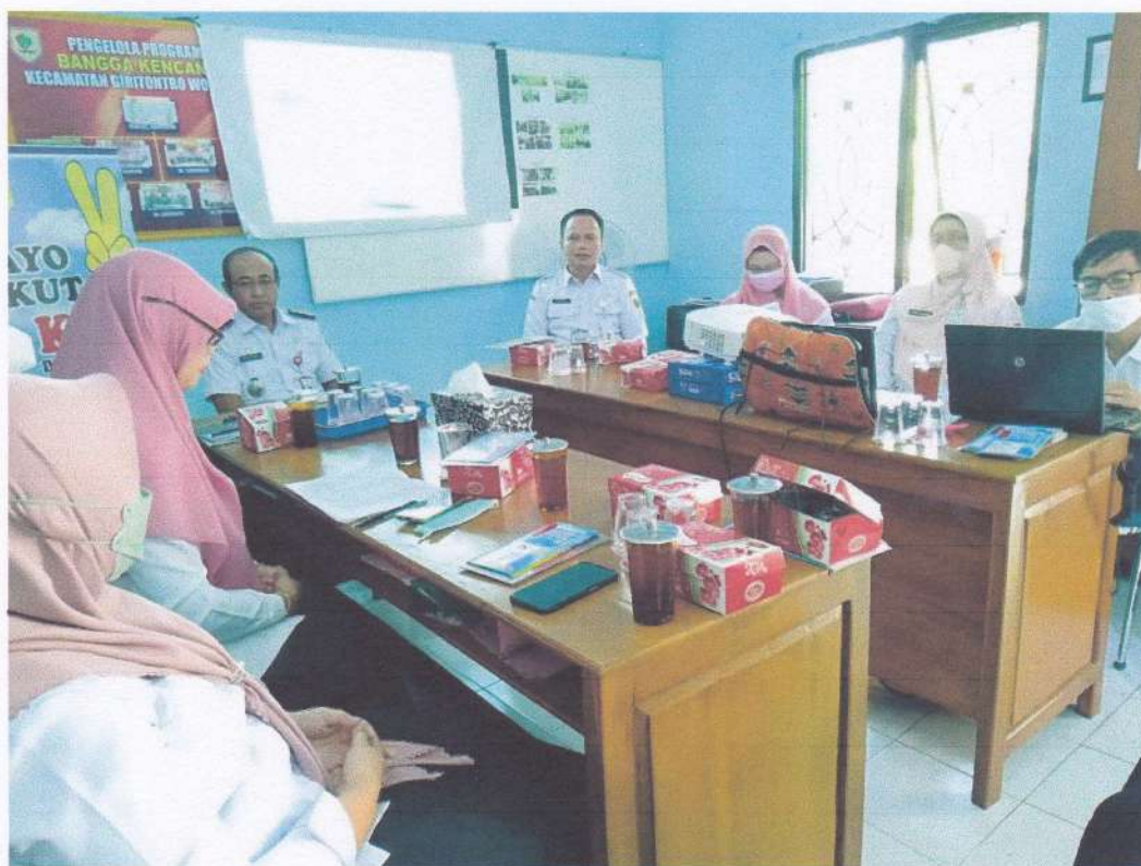
Rapat Pembahasan Rencana Daftar Informasi Publik dan Usulan Informasi yang Dikecualikan Tahun 2023