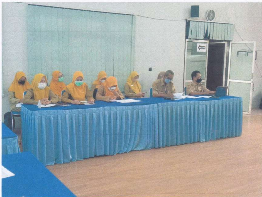
Rapat Pembahasan Penguatan PPID Melalui Peningkatan Kapasitas SDM dan Penyusunan Regulasi sebagai Petunjuk Informasi Tahun 2023